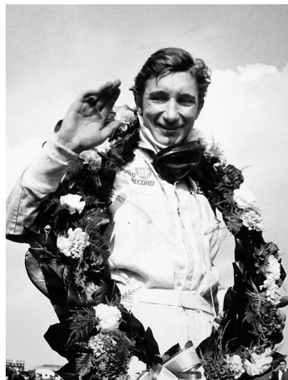
Triumph in der Formel 1 am 20. Juli 1968 in Brands Hatch, wo Siffert drei Jahre später tödlich verunglückt.