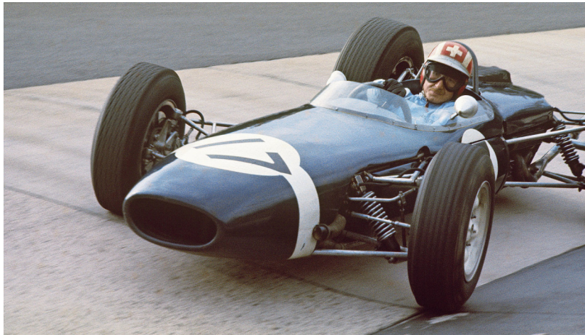
Jo Siffert 1965 mit einem Brabham-Rennwagen auf Nürburgring in Deutschland.

Mit einem Auto und dem Rennwagen auf dem Anhänger zog das «Siffert Racing Team», anfänglich bestehend aus Siffert und seinen beiden Mechanikern, los zu Rennen in ganz Europa. Siffert fuhr die Nacht durch, um am Morgen beim Training zu starten. Restaurantbesuche oder Hotelübernachtungen waren oft zu teuer. Rennteilnahmen